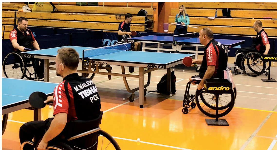
Zgrupowanie polskiej kadry osób niepełnosprawnych w tenisie stołowym

Do tej pory Polacy w tenisie stołowym na igrzyskach paraolimpijskich zdobyli 26 medali (9 złotych, 10 srebrnych, 7 brązowych). Multimedalistką igrzysk jest Natalia Partyka, która ma na swoim koncie 8 medali, w tym aż 5 złotych. Natalia jest również zawodniczką kadry narodowej osób pełnosprawnych. Poza startami na paraolimpiadzie jest także trzykrotną uczestniczką igrzysk olimpijskich.