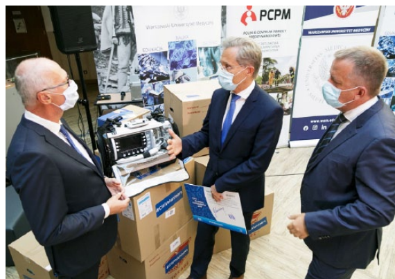
Rektor WUM (w środku), prezes Citi Handlowy (po lewej) i prezes PCPM podczas uroczystości symbolicznego przekazania darów