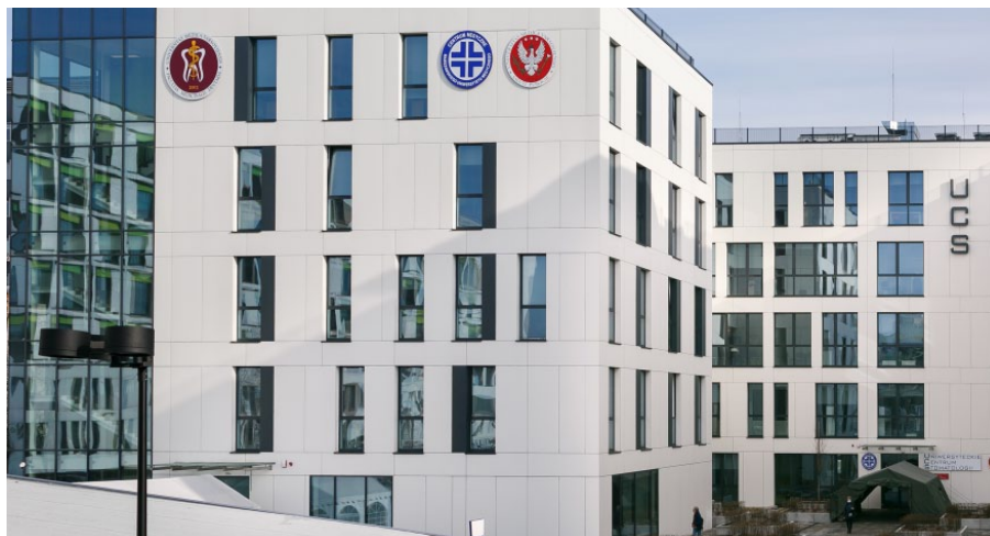
Budynek Uniwersyteckiego Centrum Stomatologii WUM

Ważnym elementem w nauczaniu studentów Wydziału Lekarsko-Stomatologicznego jest także nabycie umiejętności miękkich oraz zasad współpracy interdyscyplinarnej i pracy zespołowej. Na Wydziale prowadzone są studia na kierunkach: lekarsko-dentystycznym, techniki dentystyczne i higiena stomatologiczna. Absolwenci tych kierunków w przyszłości będą tworzyli zespół zapewniający pełną opiekę stomatologiczną swoim pacjentom. W przypadku kształcenia przyszłych lekarzy dentystów niezbędne jest nabycie umiejętności kompleksowej opieki nad pacjentem, z uwzględnieniem zarówno jego „stomatologicznych” potrzeb zdrowotnych, jak i ogólnego stanu zdrowia. Niezmiernie ważnym elementem jest więc nabywanie przez studentów wie-