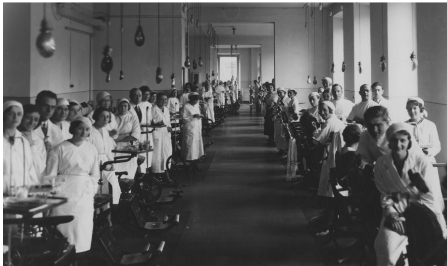
Klinika Dentystyki Zachowawczej