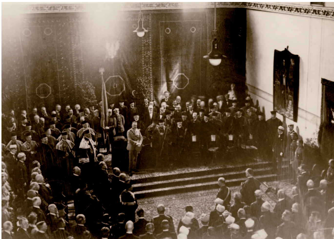
Uroczystość wręczenia insygniów rektorskich i dziekańskich władzom Uniwersytetu Warszawskiego przez Józefa Piłsudskiego w dniu 2 maja 1921 roku w auli UW w Pałacu Kazimierzowskim