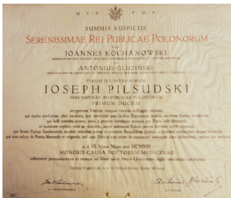
Dyplom nadania Józefowi Piłsudskiemu tytułu doktora honoris causa Wydziału Lekarskiego Uniwersytetu Warszawskiego

Mgr Grażyna Jermakowicz Muzeum Historii Medycyny WUM