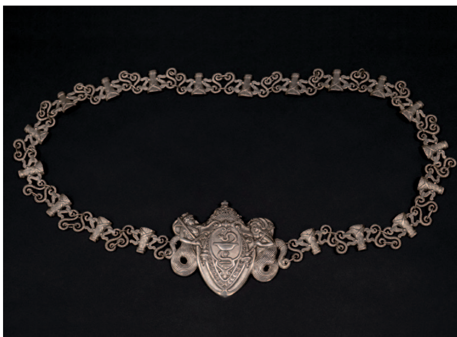
Łańcuch Wydziału Lekarskiego Uniwersytetu Warszawskiego. Replika wykonana przez firmę Braci Łopieńskich wg oryg. projektu Jerzego Smolińskiego. Własność Muzeum Historii Medycyny WUM