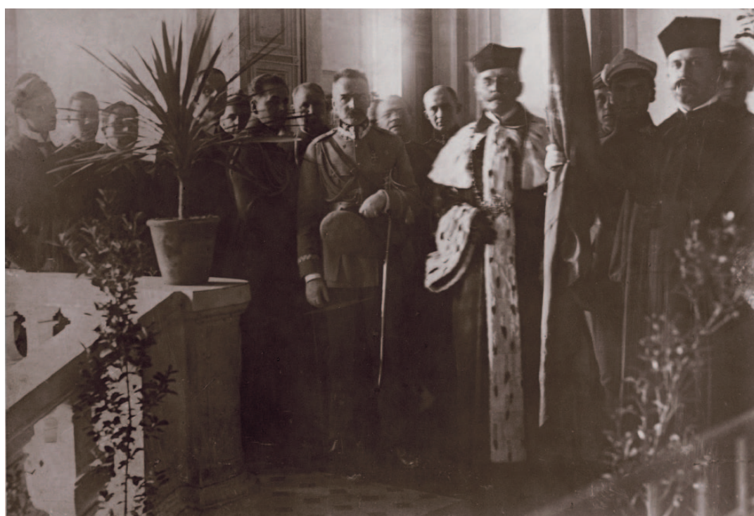
Wspólna fotografia Józefa Piłsudskiego i rektora UW prof. Jana Kochanowskiego po uroczystości w dniu 2 maja 1921 roku. Wyjście z auli UW w Pałacu Kazimierzowskim